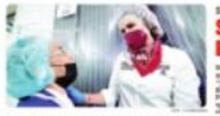
MEXICALTIC. La Secretaría de Salud se fortalece al ser familias de las ciudades fronterizas.