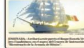
ENSENADA. Arribará este jueves el Buque Escuela "Cuauhtémoc", uno de los buques del Programa de Buques Escuelas del Estado de México.

MEXICALTIC. El Gobierno del Estado de Baja California informó que el buque escuela "Cuauhtémoc" llegará a Ensenada durante la próxima semana. El buque fue construido en el Estado de México y será el primer buque escuela que llegará a Baja California.