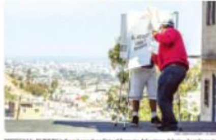
MEXICALTIC. El IEE informó que el debate del proceso electoral a la gubernatura del Estado de Baja California será el domingo 18 a partir de las 20:00 horas.

MEXICALTIC. El Sistema Estatal Electoral de Baja California (IEE), a través de la Comisión Estatal de Citación Electoral y Elecciones, informó a las 20 ciudades actor las y los candidatos a gobernador que una vez se haya autorizado por el Poder Judicial del Estado de Baja California, se llevará a cabo el debate del proceso electoral a la gubernatura el domingo 18 de abril a partir de las 20:00 horas.