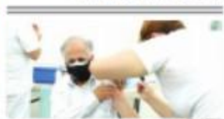
MEXICALTIC. Este jueves se realizó la vacunación masiva de segunda dosis en Mexicali, para reconstituir a la comunidad.